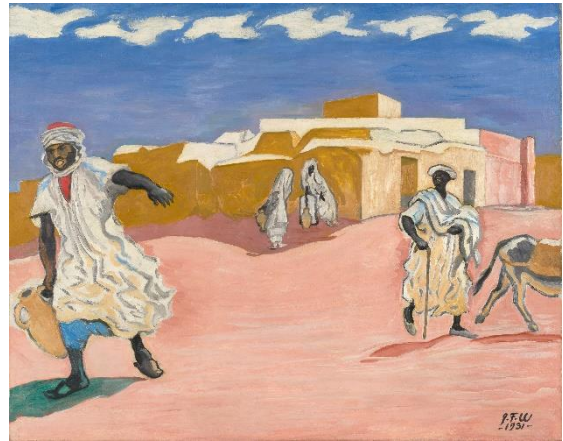
J.F. Willumsen: Arabere ved en kilde, 1931. Nasjonalmuseet Oslo.

Udstillingen dækker en periode på 80 år (1882-1962) og omfatter 13 danske kunstnere. Det gælder fx Theodor Philipsen, som drog til Tunesien allerede i 1882 og malede kameler i gaderne som enestående studier af lys og skygge.