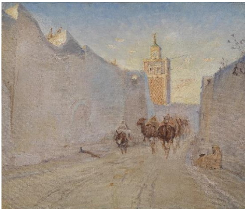
Theodor Philipsen: Gade med kameler i Tunis, 1882. Statens Museum for Kunst.

Senere dyrkede Willumsen især det hvide lys og lokale klædedragter i både Tunis og Oran, mens Olivia Holm-Møller skabte store farveudladninger med blandt andet Algeriets befolkning og natur som afsæt. Og endelig tiltrak Marrakech kunstnere som Gerda Wegener, Ejler Bille og Agnete Therkildsen, der var optaget af mønstre og ornamentik.