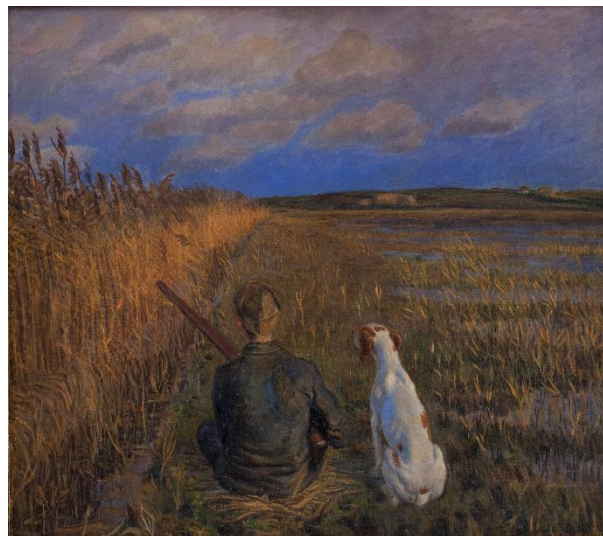
Johannes Larsen (1867-1961): På andetræk, 1895-97. Statens Museum for Kunst.

I alt præsenteres 50 kunstnere, som skildrer jagtens mennesker, dyr og landskaber på smukke, tankevækkende, dramatiske og humoristiske måder. Det gør de i maleri, skulptur, kunst på papir, fotografi og keramik. Værkerne kombineres med kulturhistoriske og naturhistoriske genstande fra jagtens verden samt filmede interviews, hvor fire aktive jægere fortæller om deres liv med jagt.