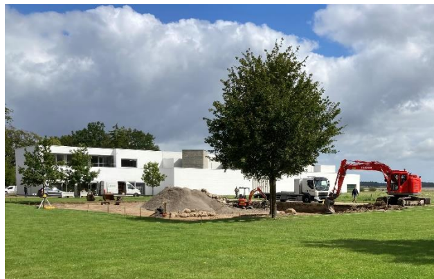
Arbejdet med Lea Porsagers kunstværk på plænen foran museet er i gang.

kulturlandskab i en integreret kunst- og naturoplevelse. Værkerne er ikke højtråbende, men etableres som diskrete elementer i det eksisterende landskab.