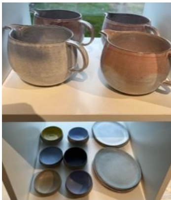
Keramik fra BKA