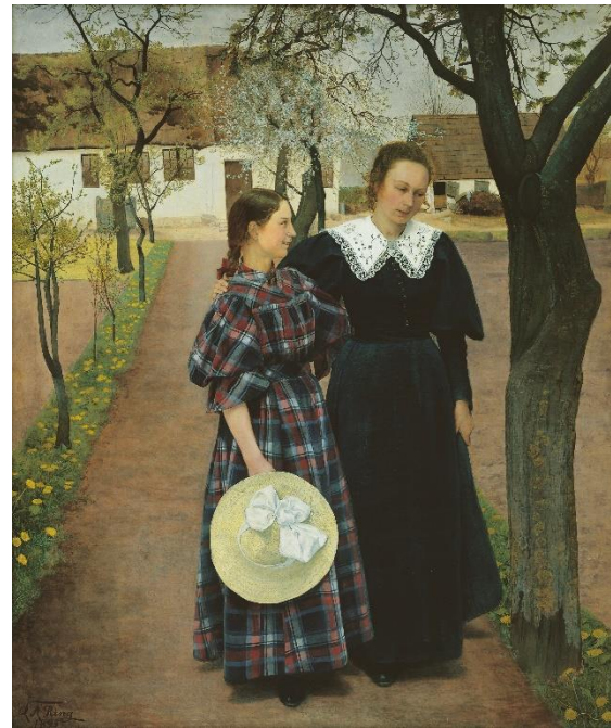
L.A. Ring: Forår . 1895. Den Hirschsprungske Samling.

Ring anså naturen for både virkelighed og symbol, og udstillingen viser dels hans nøgterne skildringer af årstidernes gang – vækst, blomstring, modning og forfald – og dels hans forståelse af naturen som en allegori på menneskelivet: Foråret som barndom og ungdom, sommeren som livets gennemlyste og afklarede midte, efteråret som aldersbetinget eftertænkning og vinteren som alderdommens sidste frysende neddrøsting. Ring udtalte i et interview sent i livet: "Uden Naturen kan jeg slet ikke tænke mig en Fremtid for Malerkunsten", og hans samlede produktion illustrerer til fulde dette udsagn: Stort set alle hans billeder er skabt i pagt med naturen. Det gælder den ydre, men også den indre natur.