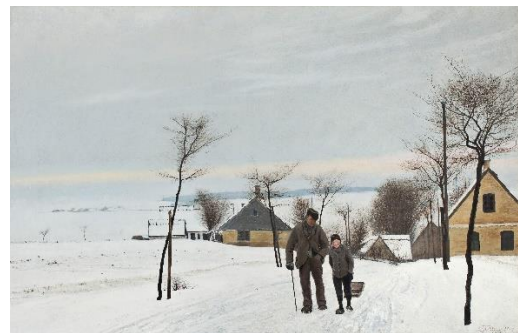
L.A. Ring: Diset vinterdag i Vinderød. 1901. Fuglsang Kunstmuseum.

Foredraget tager afsæt i udstillingen L.A. Ring - Årstiderne på Fuglsang Kunstmuseum, hvor en lang række af Rings hovedværker er samlet.