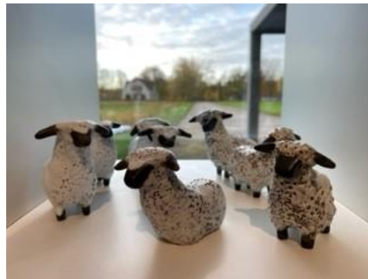
Keramik fra Lilian Adler