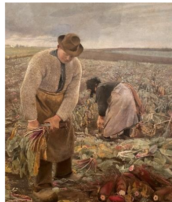
L.A. Ring: Roerne tages op . 1890. Fuglsang Kunstmuseum.

Med købet af Allan Ottes nymalede Pink Wrap har sommerens publikumssucces, udstillingen Naturligvis. Landskabsmalerier af Allan Otte , sat sig varige spor i samlingen.