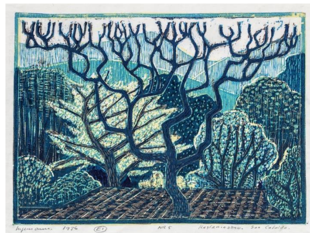
Ingemann Andersen: Kastanjeskov. San Cataldo. 1976. Træsnit. Fuglsang Kunstmuseum.

I forårets store særudstilling stiller Fuglsang Kunstmuseum skarpt på den lollandske billedkunstner Ingemann Andersen (1929-2017), som mange kender fra udstillinger, udsmykninger og museets store samling af hans værker.