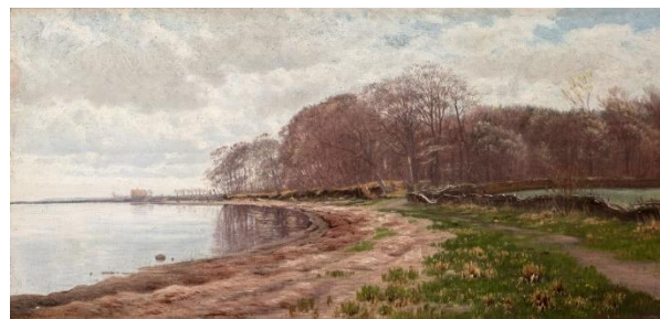
Hans Friis: Strandparti nedenfor haven ved Orenæs, mod vest, 1881 .