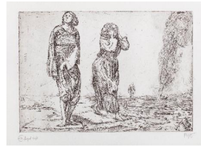
Palle Nielsen: Lethe , 1985. Fuglsang Kunstmuseum.

Nedlukningen har desværre betydet aflysning og udskydelse af mange arrangementer, bl.a. Mad & Kunst, tur til Frederiksdal Gods, En søndag på Fuglsang og koncerter i KUMUS.