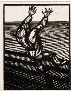
Palle Nielsen: Faldet, 1955. Fuglsang Kunstmuseum.

Når Nielsen anses for at være en af det 20. århundredes vigtigste danske tegnere og grafikere, handler det ikke kun om, at han med sine værker tolker sin samtid og dens mennesker med spiddende præcision, men om, at han gør det i et udtryk, der balancerer mellem det klart aflæselige og det gådefulde. Katastrofer og eksistentielle grundproblematikker fremstilles med et æstetisk overskud, der betyder, at selv de mest kaotiske scener udtrykkes i et præcist og velkomponeret formsprog.