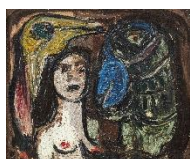
Asger Jorn. Den hvide dame fra Vrads . 1953. Collection Siemers- von Loeper.

I anledningen af særudstillingen På sporet af Cobra. Vilde visioner 1930 – 2000 indbyder venneforeningen til en aften i Cobraens tegn, hvor vores faste madmor Joan Thorlin serverer en lækker menu baseret på lokalproducerede råvarer.