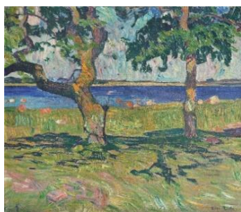
Olaf Rude: Landskab, Skejten , 1911. Olie på lærred. 79 x 90 cm.

Maleren Olaf Rude (1886-1957) er en af Fuglsang