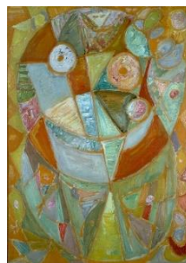
Egill Jacobsen: Sommer . 1948. Foto: Fuglsang Kunstmuseum

Museets formidler Guri Skygge Andersen er med i hele forløbet.