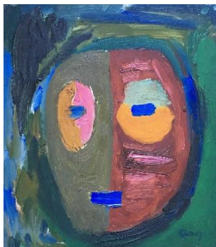
Asger Jorn. Uden titel . 1941. Collection Siemers-von Loeper.

Fuglsang Kunstmuseum har en fornem samling af prominente danske Cobrafolk som Asger Jorn, Carl-Henning Pedersen og Egill Jacobsen. Deres populære værker vises jævnligt i udstillingssalene, og de efterspørges ofte af museets gæster. Med forårets særudstilling På sporet af Cobra. Vilde visioner 1930-2000 sætter museet imidlertid fuldt blus på Cobras visionære og mangeartede veje op gennem det 20. århundrede: fra ansatserne i 1930'erne, de officielle tre år omkring 1950, til de forskellige kunstneriske og ideologiske aftryk i eftertiden. Der vises 60 værker af kunstnere, som stadig identificeres stærkt med Cobra, men der er også plads til de, som i dag er mindre kendte eller mest forbindes med andre strømninger og sammenslutninger.