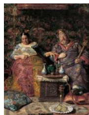
Kristian Zahrtmann: Der var engang en konge og en dronning . 1886-87. Den Hirschsprungske Samling.

Familieworkshop. Kan man lave billeder, der er "for meget af det gode"? Efter at have set på særudstillingen, laver vi selv billeder med farver og mønster og glimmer og spræl i billedkunstværkstedet. Pris: 25 kr. pr. deltager (børn og deres voksne).