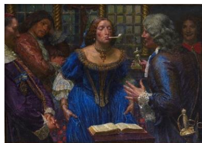
Kristian Zahrtmann: Dronning Kristina i Palazzo Corsini. 1908. Statens Museum for Kunst.