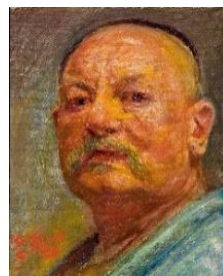
Kristian Zahrtmann: Selvportræt i lampelys. 1916. Fuglsang Kunstmuseum.