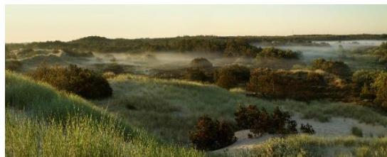
Janne Klerk: Råbjerg Mile II . Skagen Odde 2008

Omvisning: "Naturmotiver fra Skejten - med perspektiver til Janne Klerks kystlandskaber". Åbent til kl. 20.