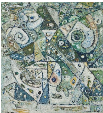
Ejler Bille: Improvisation. 1960.

Erik Thommesen indtager lomme C, og i lomme D er der et festfyrværkeri af farver og ord med Carl-Henning Pedersens Jerusalems syv porte , en grafikmappe med otte blade fra 1975. Tre af bladene er kunstnerens egne kalligraferede digte og tekster til billederne, så med ophængningen lader vi kunstneren selv skrive værkskiltene! Værket indgår i den gave, der ankom til museet i december 2016 fra ejeren af Galerie von Loeper i Hamborg.