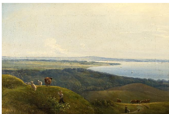
Thorald Brendstrup: Udsigt fra Skamlingsbanken. 1854. Tilhører Fuglsang Kunstmuseum.

Meget interessant, hvad forgangen forskning også kan føre med sig!! – Dengang opdagede vi jo, at Brendstrup var meget dårligt repræsenteret