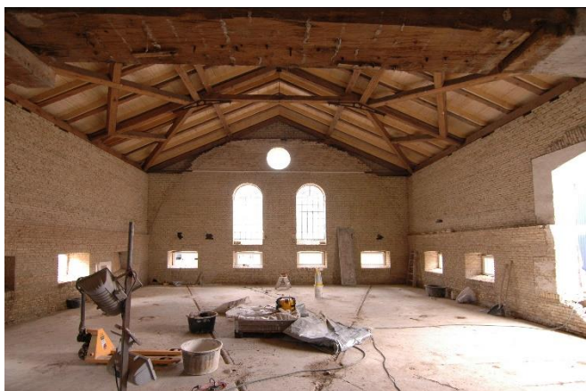
Den kommende koncertsal.

Håndværkerne er stadig i fuld gang i museets nabobygning, den tidligere forpagterbolig. Men om få måneder er det slut. Torsdag den 12. maj vil bygningen blive officielt indviet efter endt renovering, hvorefter Fuglsang Kunstmuseum og Storstrøms Kammerensemble rykker ind.