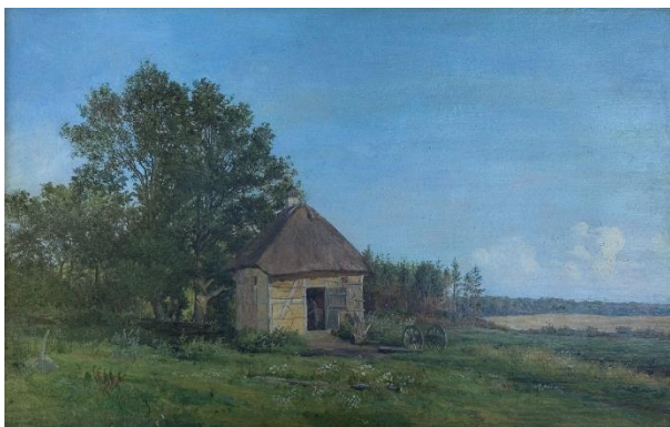
Thorald Brendstrup: En herregårdssmedje. Søholt. 1846. Tilhører Fuglsang Kunstmuseum.