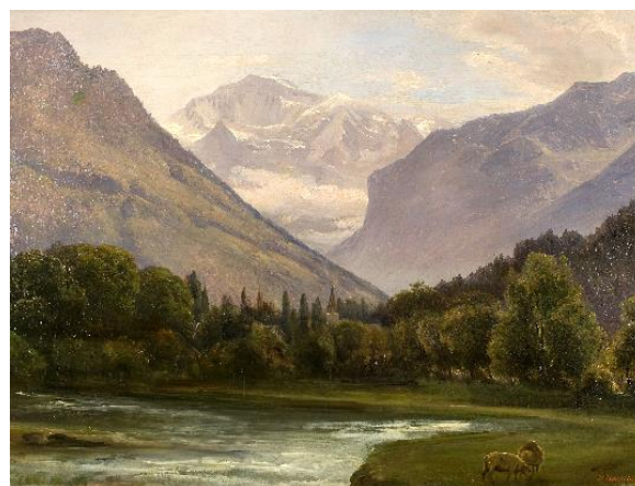
Thorald Brendstrup: Ved Interlaken, Schweiz. U.å. Tilhører Fuglsang Kunstmuseum.

Motiverne dækker både lokale lokaliteter, men også flere fine jyske landskaber og et enkelt rejsebillede fra Schweiz.