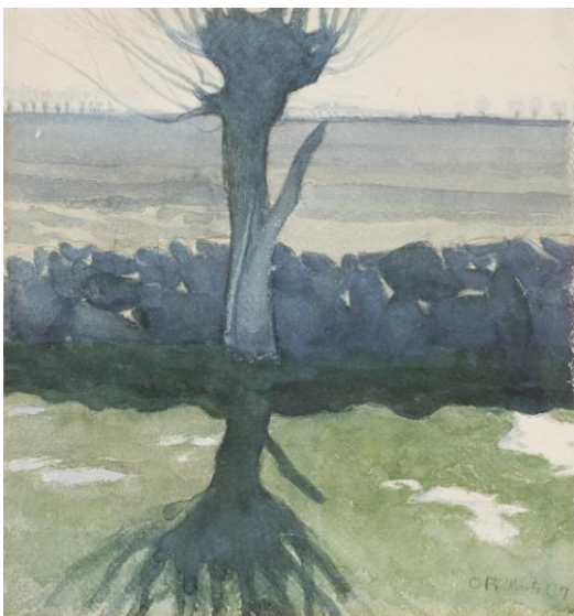
Olaf Rude, Stynet poppel og stengærde i modlys, Frejlev Enge, Lolland, 1907.

Mange kender Olaf Rude (1886-1957), hvis malerier næsten altid er udstillet i Fuglsang Kunstmuseums sale. Udover denne fornemme samling ejer museet også en række indtagende akvareller af kunstneren, for Rude var passioneret akvarelmaler, der livet igennem tog på 'akvarel-ture' for at skildre især naturens forunderlige mangfoldighed.